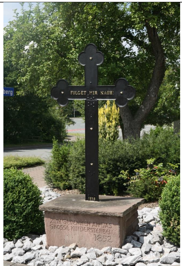
(nach der Restaurierung)